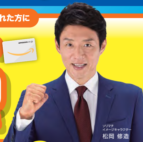
ソリマチ イメージキャラクター 松岡 修造