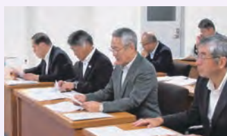
団体長による要望事項の説明

去る九月八日、福島県商工会連合会、福島県商工会議所連合会、福島県中小企業団体中央会の商工三団体及び福島県信用保証協会は、自由民主党福島県議会議員会、福島県議会議員連合議員会、公明党福島県議会議員団に対し、令和八年度福島県予算編成に向けた要望活動を行いました。