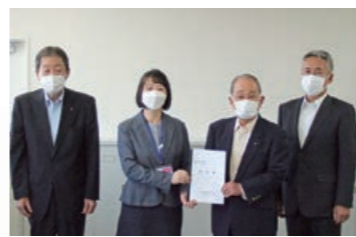
小笠原商工労働部長との要望書手交