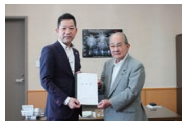
越智俊之参議院議員との要望書手交